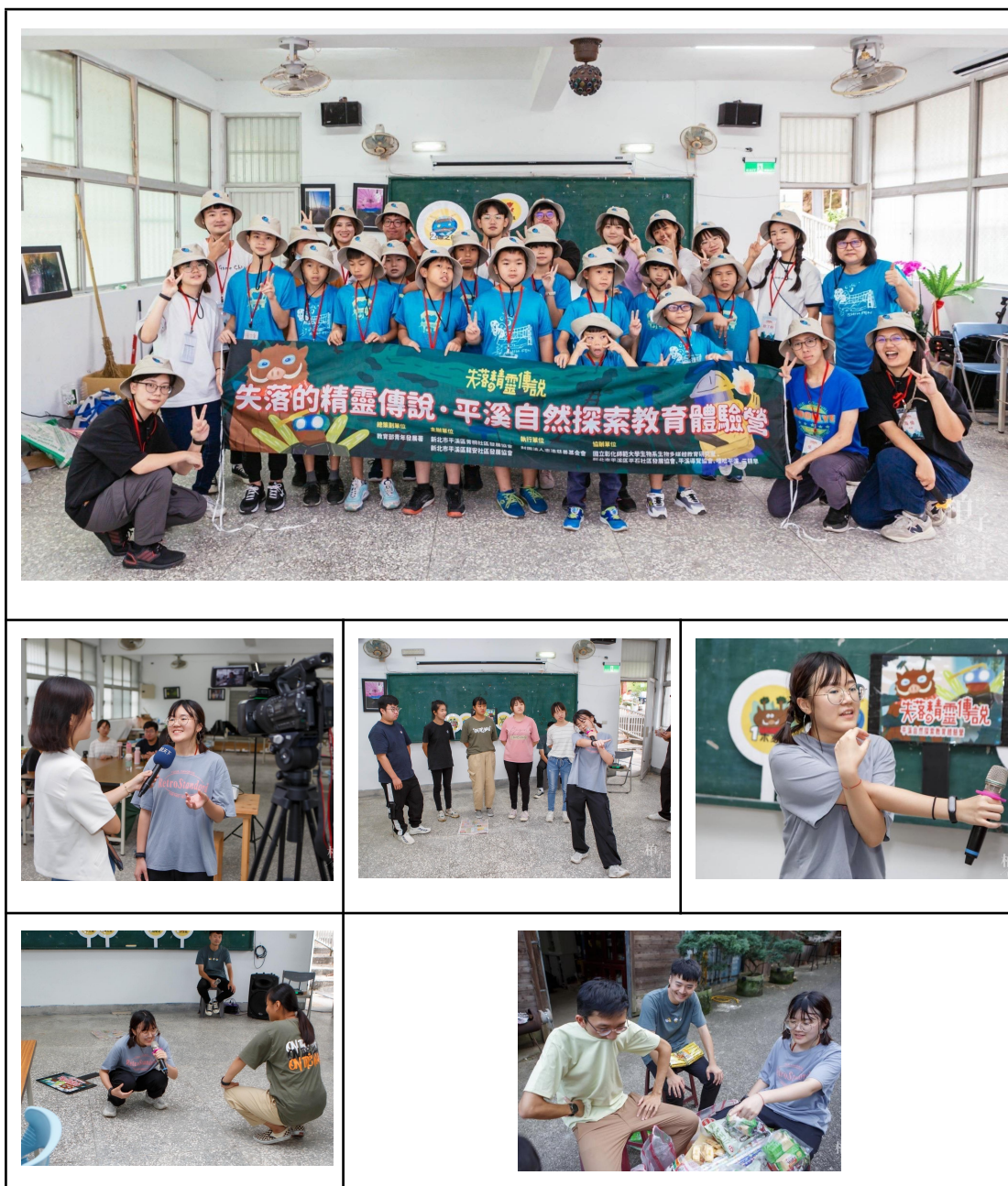
社會關懷活動照片- 台北市西區少年服務中心-據點陪伴: