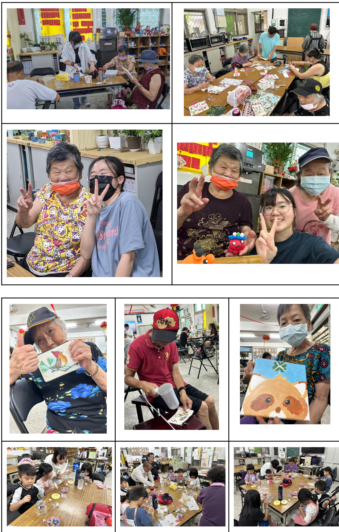
社會關懷活動照片-菁桐社區陪伴長者與社區孩童