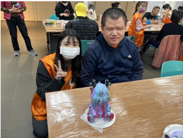
▲ 伊甸一日志工－流體龍彩繪