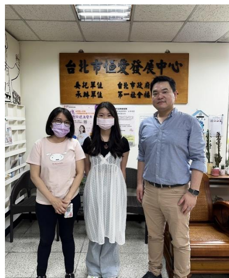
▲ 恆愛服務－與社工、關懷導師合照