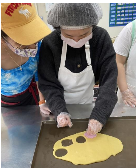
▲ 恆愛服務－烘焙班作業